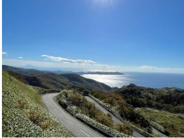
竜泊ライン (イメージ)

予約制 最少催行人数4名 ※申し込みは乗車日の1ヶ月前から7日前まで ※予約がない場合は運休