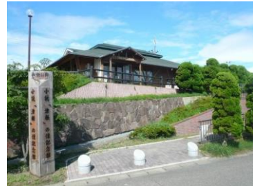
小説「津軽」の像記念館 (イメージ)