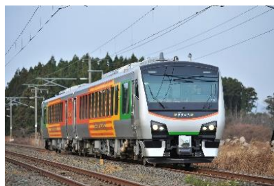
リゾートあすなる