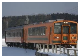
津軽鉄道(貸切ストーブ列車)

津軽鉄道や弘南鉄道に乗車して津軽を満喫する旅行商品を販売します。詳細は準備でき次第お知らせします。