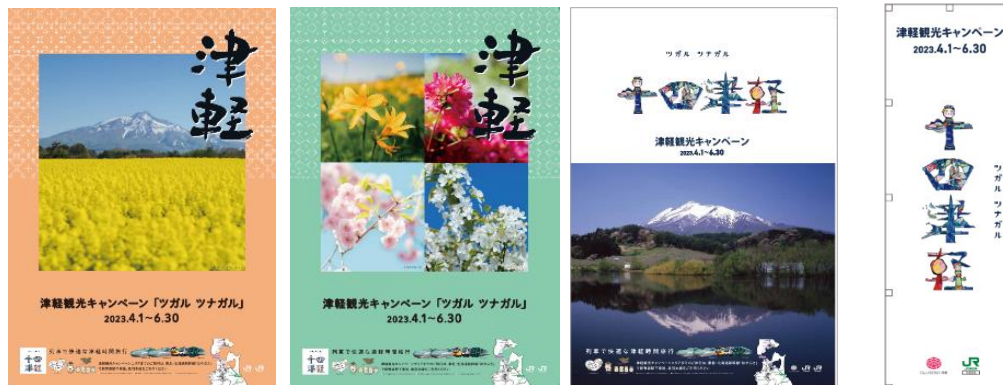
ポスター例(5種制作)